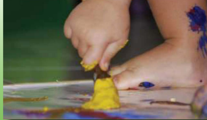
Genau DAS, was Kinder brauchen