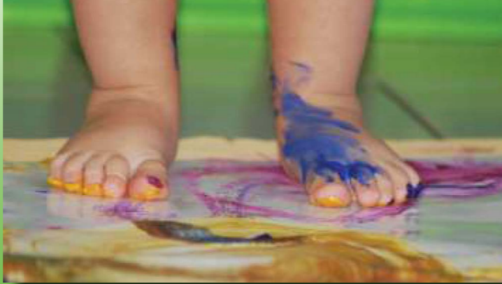
Genau DAS, was Familien brauchen